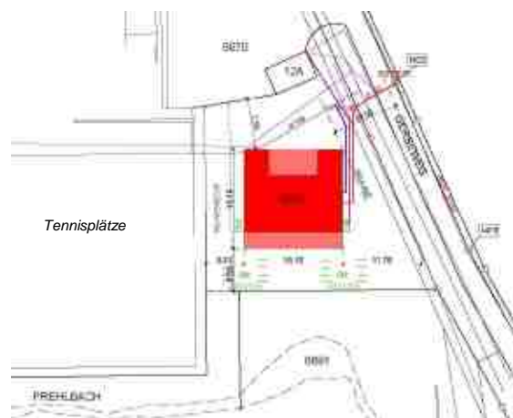
Situation am Gerbeweg 14, Murten

Die Arbeitsgruppe neues Pfadiheim hat unter Beizug der Architekten Alexa Dürig und Tomas Guthknecht ein Projekt basierend auf einem gebrauchten Pavillon ausgearbeitet. Das Gebäude passt ins vorgegebene Baufeld und erfüllt die Anforderungen der Pfadi. Es enthält ein Materiallager, einen Versammlungsraum, Gruppenräume, Küche und sanitäre Einrichtungen. Das Projekt kostet voraussichtlich weniger als 100'000 Franken und lässt sich etappieren.