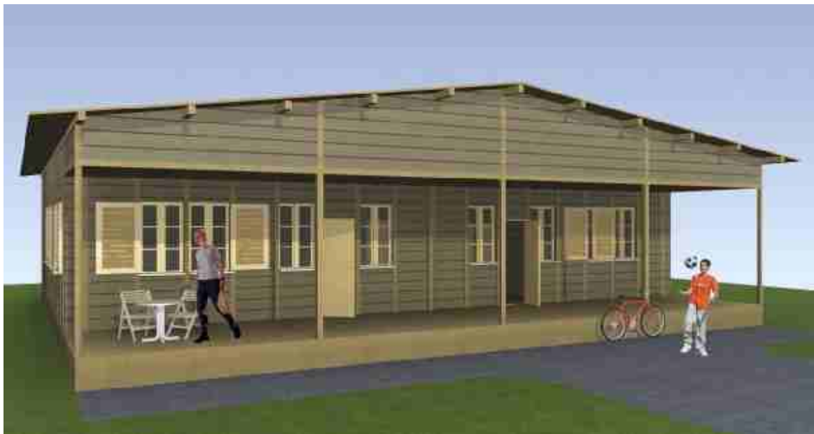
Modell des Pfadiheims am Gerbeweg 14, Murten (3D-Architekten, Kerzers)